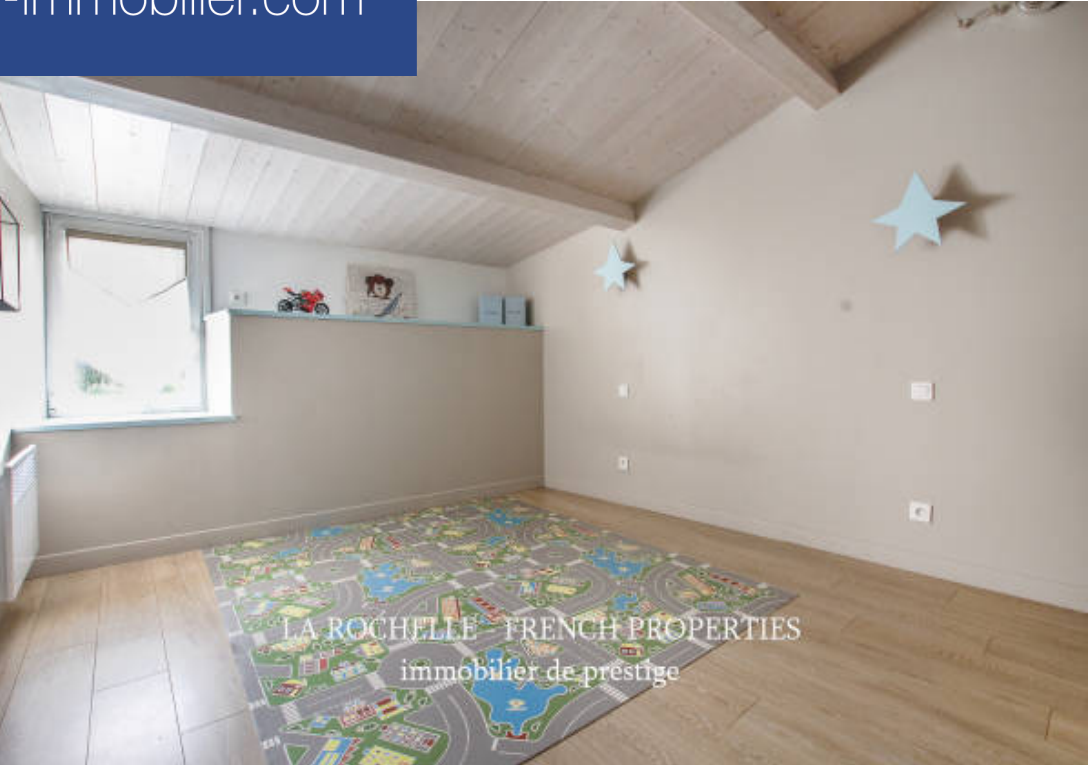
LA ROCHELLE - FRENCH PROPERTIES immobilier de prestige