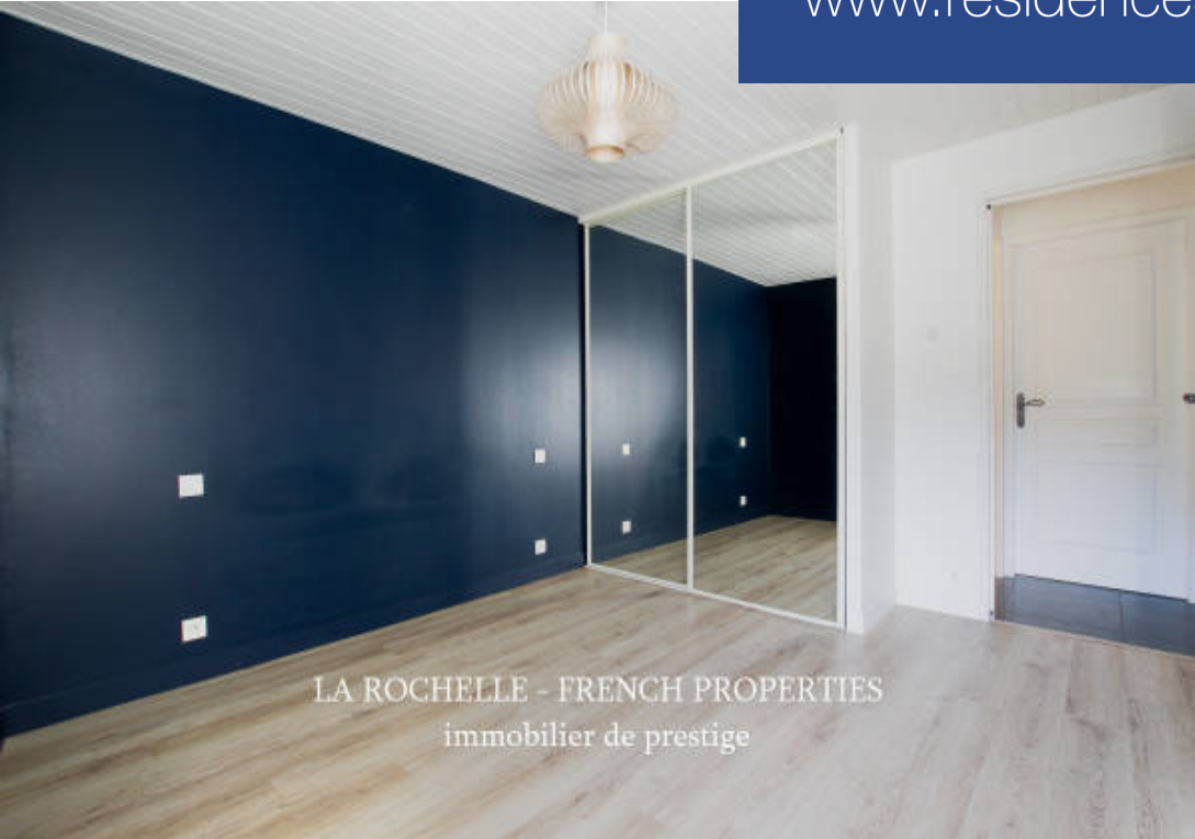
LA ROCHELLE - FRENCH PROPERTIES immobilier de prestige