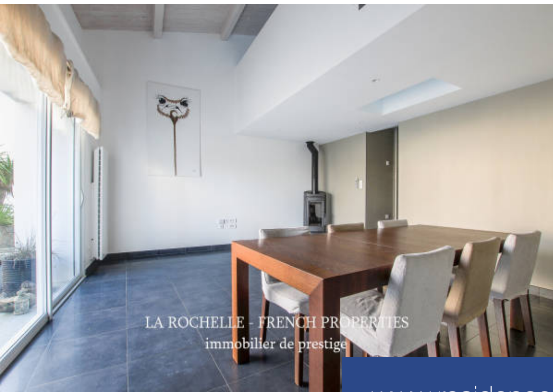
LA ROCHELLE - FRENCH PROPERTIES immobilier de prestige