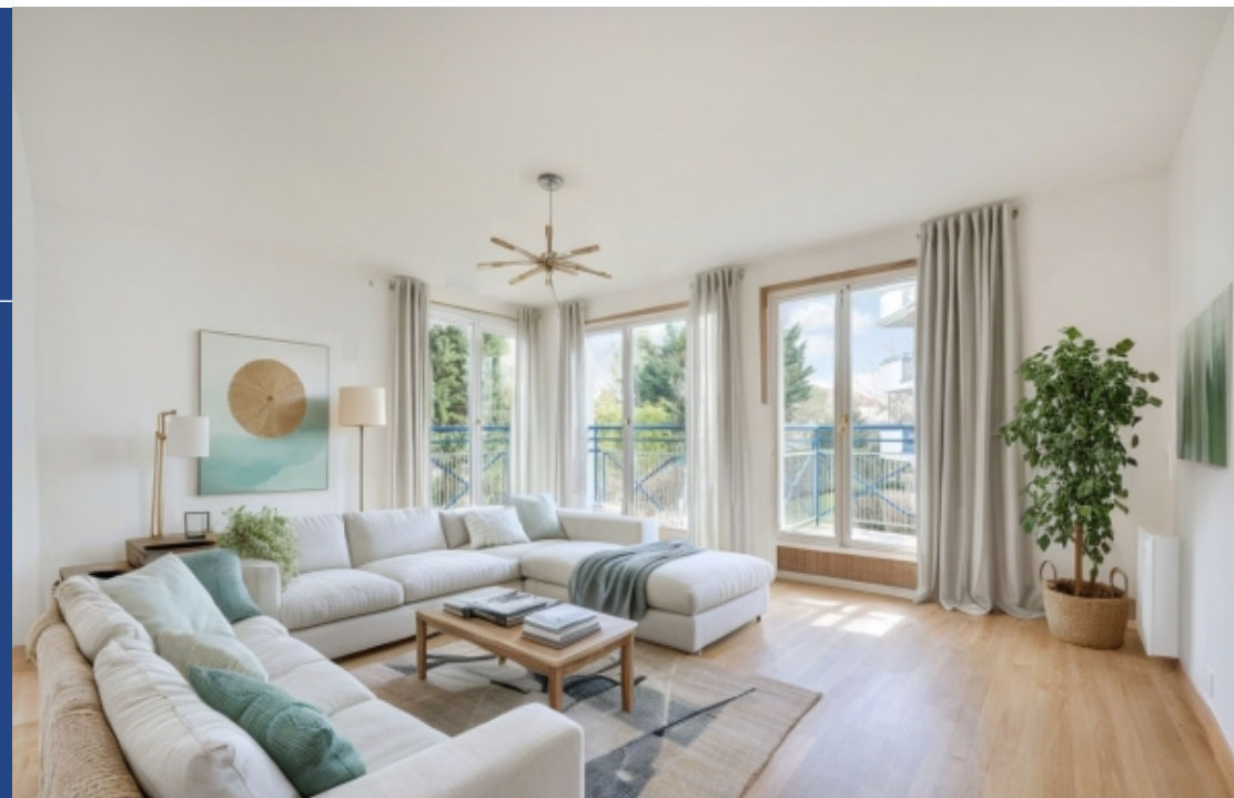
Proposition d'aménagement virtuel non contractuelle proposée par Flaash.ai