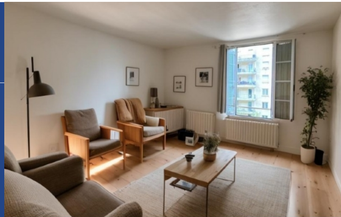
Proposition d'aménagement virtuel non contractuelle