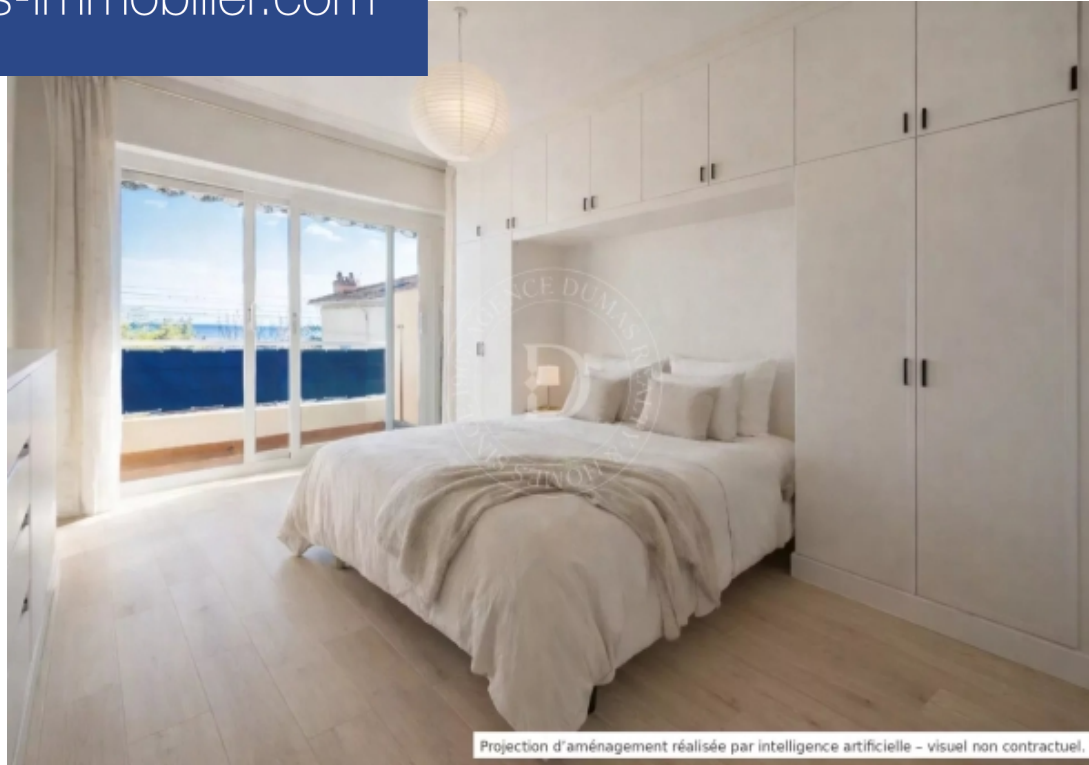
Projection d'aménagement réalisée par intelligence artificielle - visuel non contractuel.