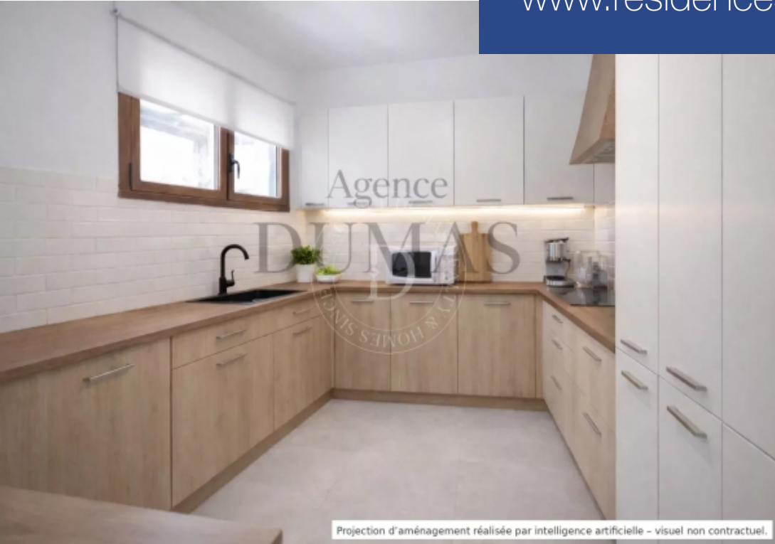
Projection d'aménagement réalisée par intelligence artificielle - visuel non contractuel.