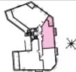
APPARTEMENT n°22 Etage: R+2 - Type: T2